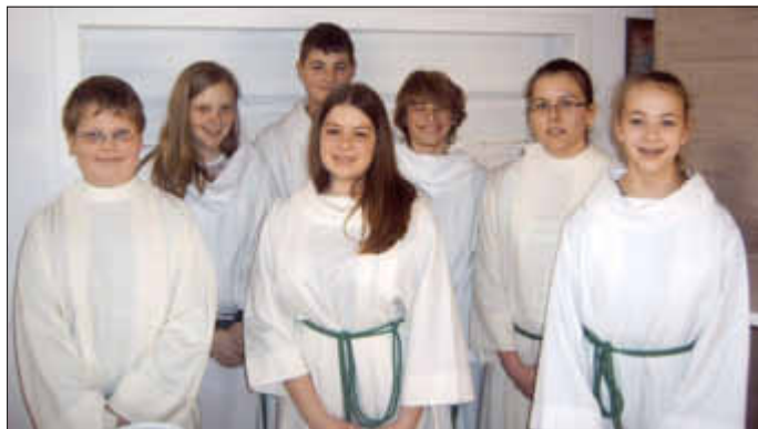
Die Minis aus Furfeld, Neu-Bamberg, Wöllstein und Gau-Bickelheim

Da die Kosten dieser Reise rund 500 Euro pro Person betragen und dazu noch die Ausgaben für die Verpflegung, außer dem Frühstück, hinzukommen werden, hat die Gruppe damit begonnen, Benefizveranstaltungen für diese Jugendwallfahrt durchzuführen. Die erste gemeinsame Aktion konnte nach dem Sonntagsgottesdienst am 16. Februar in Wöllstein durchgeführt werden. Die jungen Christen hatten für Kaffee und Kuchen gesorgt, alle gemeinsam im Gottesdienst den Ministrantendienst übernommen und im Anschluss zum Kirchencafé eingeladen. Das Ergebnis ließ sich sehen: 225 Euro gingen ein. Weitere Aktionen werden die Jugendsammelwoche und ein ähnlicher Gottesdienst in Gau-Bickelheim sein. Die Gruppenleiter freuen sich über das Engagement der Jugendlichen und die Unterstützung durch die Gläubigen, die es so erleichtern, die Romreise möglich zu machen.