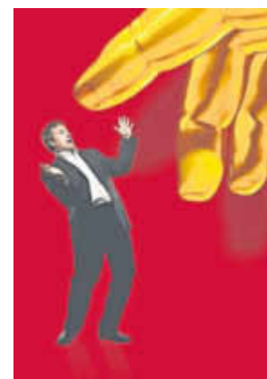
Foto: Mario Andrey, Komposition: seideldesign, Hand: diez.artwork-fotofolia

sowie bei den SPD Ortsvereinsvorsitzenden in der Verbandsgemeinde Bad Kreuznach erhältlich.