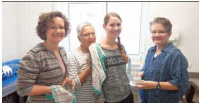
Das Team vom Fastenessen!

5. Fastenessen: Unser erstes Fastenessen in Siefersheim erbrachte 400 Euro für die gute und lebensnotwendige Sache. Wir danken allen, den Frauen und Männern, die das leckere Essen vorbereitet und den Service übernommen haben. Wir freuen uns auf Ihren Besuch.