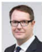
Alexander Schweitzer Minister für Soziales, Arbeit, Gesundheit und Demografie des Landes Rheinland-Pfalz

Dienstag, 29. April, 19:00 Gemeindezentrum Wöllstein mit