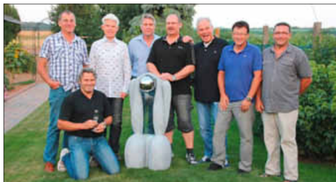
Die Aufsteiger 2013 vlnr:

Weitere Infos auch unter www.tc-woellstein.de