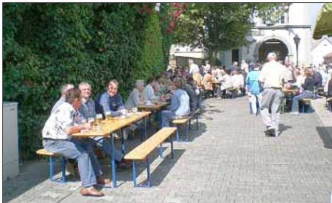
Unmittelbar vor dem Rathaus und in der Bachgasse treffen sich am 9. Juni alle Generationen zu einem vergnüglichen und entspannten Nachmittag.

Sollte wider Erwarten das Wetter am Pfingstmontag das Bürgerfest im Freien verhindern, findet die Veranstaltung in der Gemeindehalle statt.