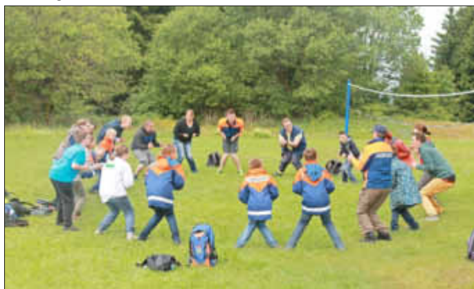
Spielerisch übten die Jugendlichen den Zusammenhalt im Team ein.

Die erste Station des Ausflugs der Jugendfeuerwehr Stein-Bockenheim 2014 war die Besichtigung der Firma Schmidt, Agrar-Technik, deren Inhaber ein gebürtiger Stein-Bockenheimer ist. Nach einem schmackhaften Grillenerlebnis bezog die Reisegruppe später Quartier in der Jugendherberge auf dem Simmerberg in Schnett. Zimmerbelegung, Lagebesprechung und ein Spieleabend rundeten den ersten Reisetag ab.