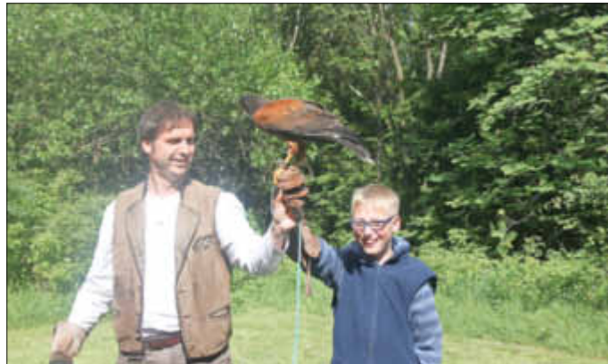
Ein ganz besonderes Erlebnis war der Besuch beim Falkner.

Am dritten Tag lernten die Jugendlichen am Vormittag den amerikanischen Rotfalken Akri, die Frettchen Frads und Fredi und den Wachtelhund Lusi kennen. Lernaufgabe: den Lebensraum von Jagd- und Beutetieren erfahren. Mit Teamstärkung auf selbst gebastelten Schwingseilen sowie Erster Hilfe unter erschwerten Bedingungen klang die Reise dann aus.