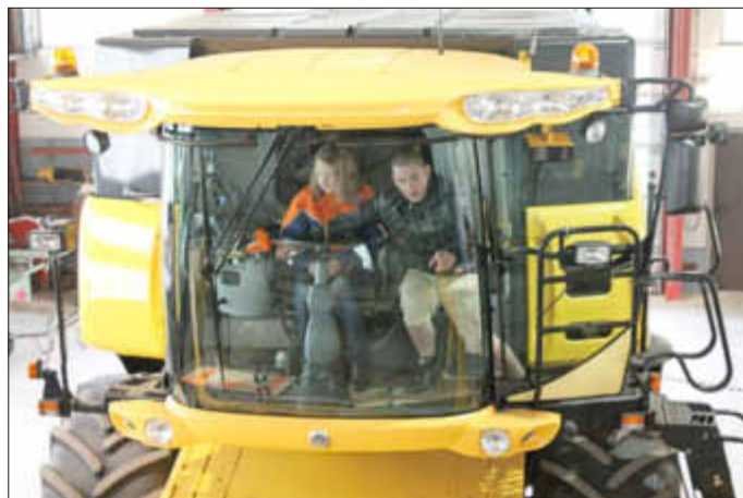
Gewaltige landwirtschaftliche Maschinen wurden bei der Firma Schmidt, Agrartechnik besichtigt.