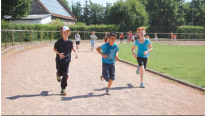
Die Appelbachkinder laufen, laufen und laufen