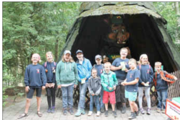
Die Freude über den schönen Tag ist den Bambinis anzusehen.