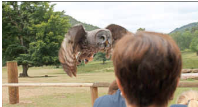
Beeindruckend: eine Eule im Anflug.