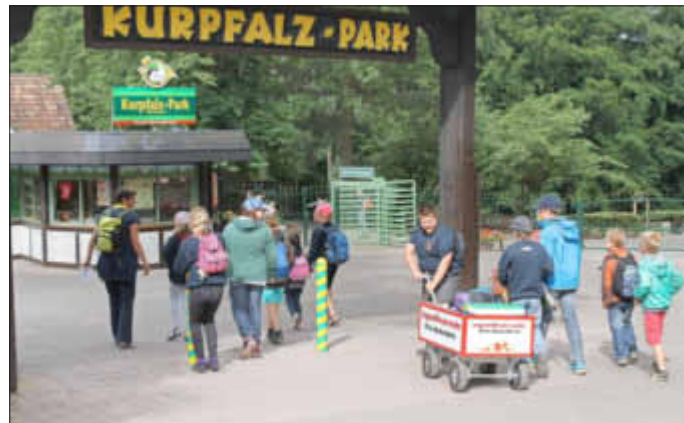
Mit dem Bollerwagen wurde der Park gestürmt.