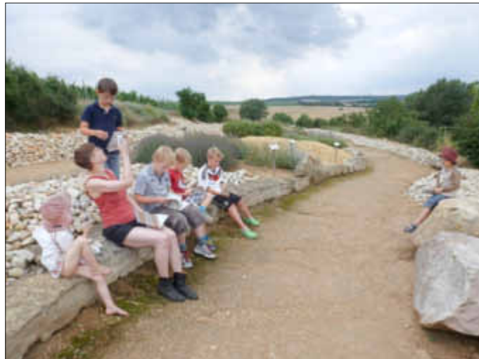
Gleich wurde das Entdeckerheft vor Ort neugierig in Beschlag genommen.

Es wird noch bekannt gegeben, wo das Entdeckerheft kostenlos zu bekommen sein wird!