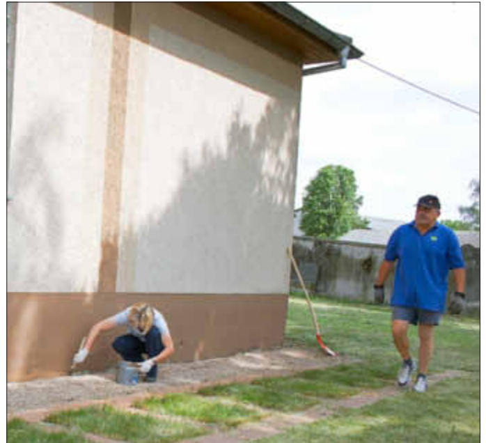
Es ist nur eine kleine Aktion gewesen, und es handelt sich nur um eine oberflächliche Behandlung, doch es ist ein Anfang. Mit Spaß und guter Laune für Eckelsheim da gewesen: