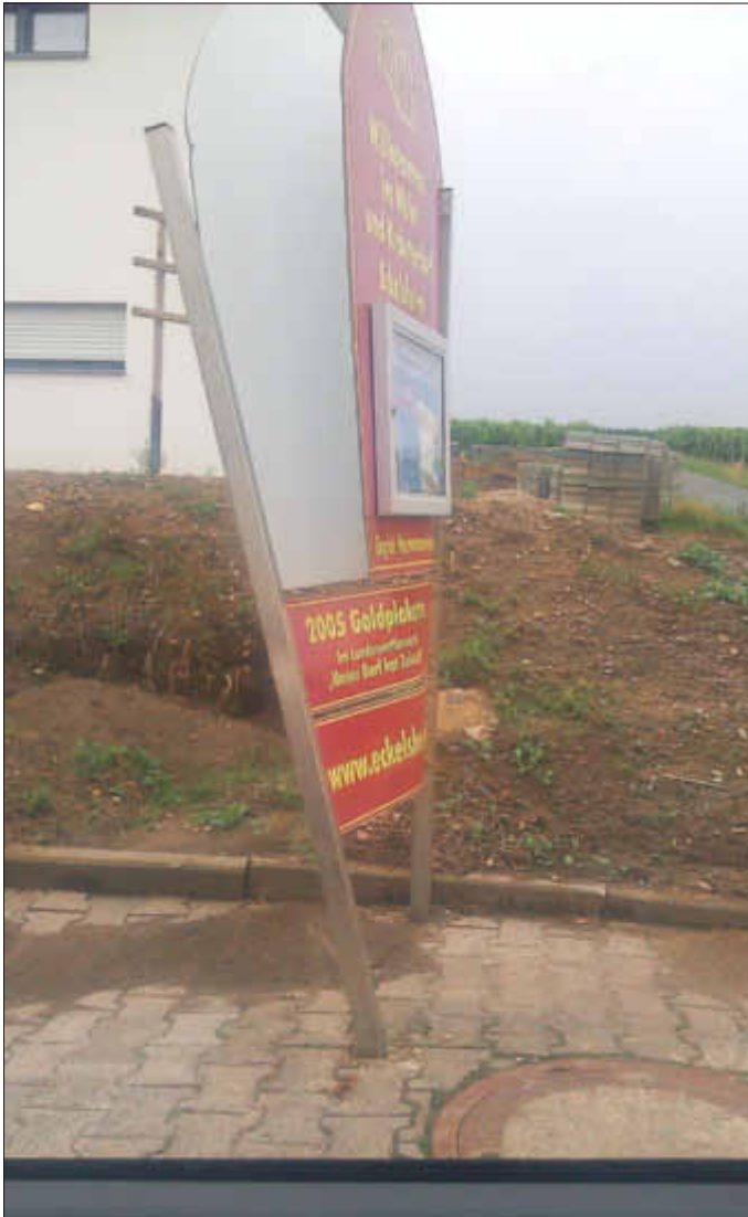
Wer etwas gesehen hat, wird gebeten, sich bei der Eckelsheimer Verwaltung zu melden. Vielen Dank für Ihre Mithilfe.