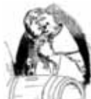
Auch gibt es wieder, das ist fein, vom Fass den edlen, guten Wein.