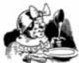
Das Essen, das ist ein Gedicht, Hunsrücker Pfundgerollte sind gerichtet.