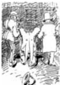
Bringt man den letzten Zecher aus, dann ist das schöne Festchen aus.