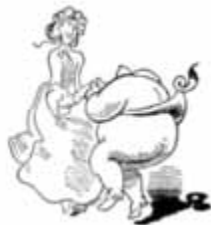
Es wird geschunkelt und gelacht, bis die Tenn' zusammenkracht.