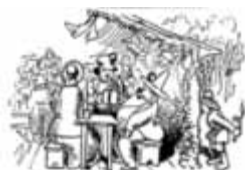
In Toni's Tenne geht es rund, dieses tun wir hiermit kund.