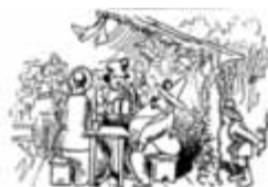
In Toni's Tenne geht es rund, dieses tun wir hiermit kund.