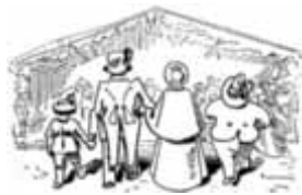
Ob groß, ob klein, ob Mann, ob Frau, heute geht es zum GV