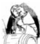
Auch gibt es wieder, das ist fein, vom Fass den edlen, guten Wein.