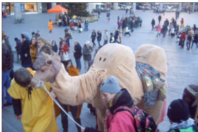
Karimm freut sich auf Euch!

2. Mit Karimm nach Paderborn: Wir fahren vom 28. bis 30. Dezember nach Paderborn und werden dort im Pater Josef Kentenich-Zentrum Paderborn-Bennhausen zu Gast sein. Schon heute danken wir der dortigen Schönstatt-Familie für die Gastfreundschaft. Da nur 18 Personen an der Sternsingerreise werden teilnehmen können, bitten wir ab sofort um telefonische Voranmeldung aller Sternsinger, Ministranten und Pfadfinder, die mitkommen möchten. Natürlich werden wir uns am 29.12.2014 Paderborn ansehen und am 30.12.2014 mit Karimm an der Sternsingeraussendung teilnehmen. Kosten: 50 Euro pro Person! Anreise mit den Pfarrbussen!