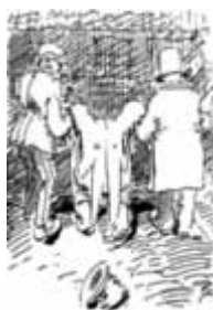
Bringt man den letzten Zecher raus, dann ist das schöne Festchen aus.