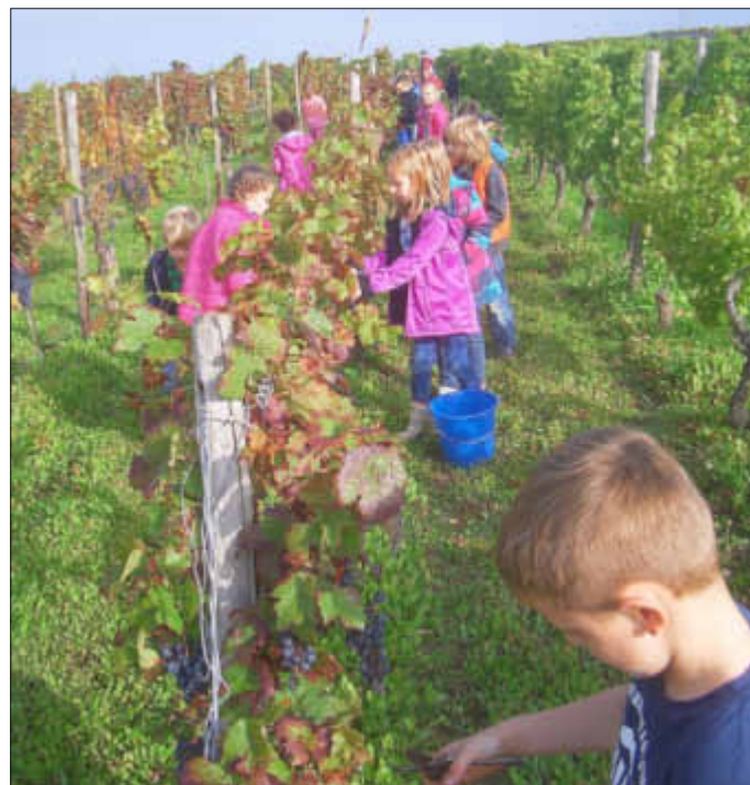
Während der Lese.