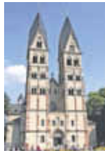
Basilika St. Kastor