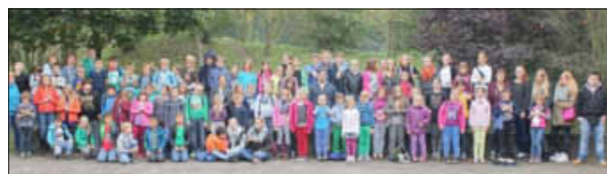
Alle Kinder mit Betreuern: Im Gemeindezentrum war richtig was los.

Den ganzen Tag nur basteln und werkeln geht natürlich nicht. Zwischendurch konnten die Kinder auch mal Ball- und Laufspiele mit den Betreuern machen, nach eineinhalb bis zwei Stunden war vormittags die Luft erstmal raus. Das war ja kein Problem, solange das Wetter mitspielte. Am Mittwoch war das nicht der Fall, da hat es geregnet, war windig und kalt. Aber das Betreuersteam wusste Rat: Im Gemeindezentrum wurden Tische und Stühle zusammengeschieben und Platz geschaffen, damit die Kinder sich drinnen ein bisschen austoben konnten.