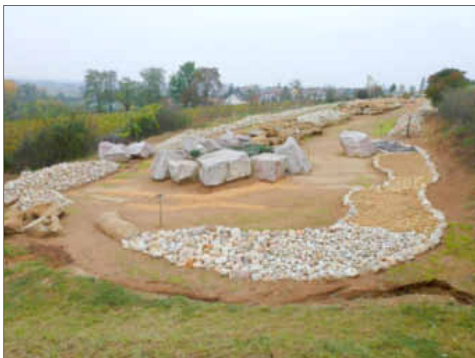
Vor dem Barfußpfad sind noch Ausspülungen erkennbar, deshalb Vorsicht bei der Begehung der Station 2, sowie des gesamten Strandpfades