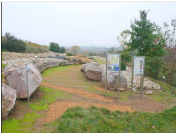
Am Eingang zur Station 2 sind die Verfüllungen der Querrinnen sichtbar

Es ist aber dennoch möglich, die Station 2 zu begehen. Der Strandpfad ist frei zugänglich. Festes Schuhwerk ist empfehlenswert. Besucher sind angehalten, äußerst vorsichtig zu sein und den Blick auf den Weg nicht zu vernachlässigen. Die Begehung des Strandpfades erfolgt auf eigene Gefahr, eine Haftung für Unfälle und Schäden kann nicht übernommen werden.