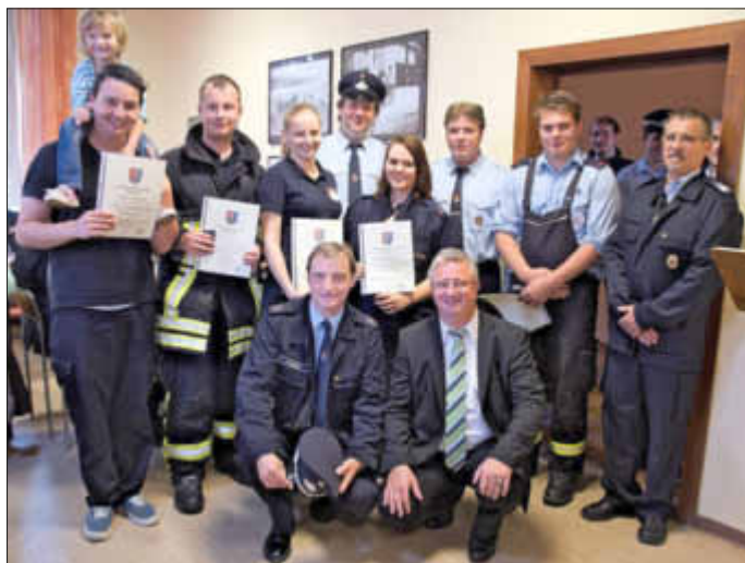
Beförderungen zum Oberfeuerwehrmann/Oberfeuerwehrfrau.