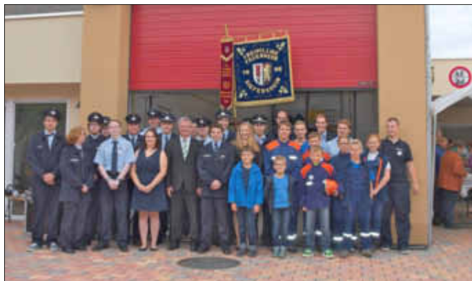
Die feierliche Einweihung des neuen Gerätehauses.