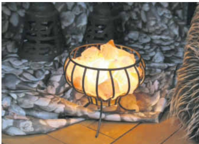
Salzkristalleuchten schaffen eine behagliche Atmosphre.

Gips-Wandleuchten, welche im Vorfeld selbst bemalt werden kfnnen, sind etwas Besonderes ffr besondere Menschen. Ffr eine romantische Stimmung zu zweit dagegen sind LED-Kerzen mit echtem Wachsmantel eine schfne Idee. Bei diesen besteht zudem keine Brandgefahr, so dass sich auch Kinder gefahrlos an dem Kerzenlicht erfreuen kfnnen. Wer nach einem kleinen Glfcksbringer ffr Tierfreunde sucht, ist wiederum mit einer batteriebetriebenen Leuchtfigur gut beraten. Diese formen die Silhouetten von Katzen oder Hunden nach. So findet sich ffr jeden Menschen das passende, leuchtende Geschenk.