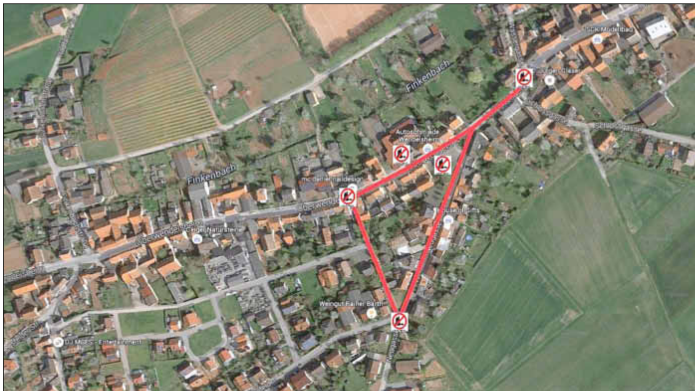
Bannmeile Nachtumzug Wendelsheim 2016