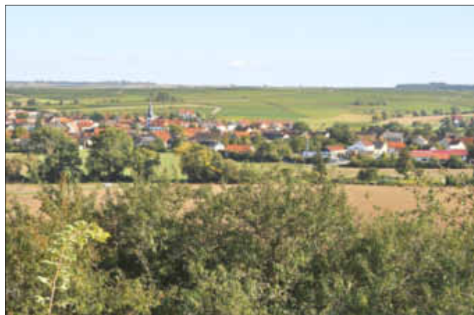
Genießen wir die tolle Sicht auf Wonsheim