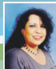
Ich berate Sie gerne!

IHRE ANSPRECHPARTNERIN für Anzeigenwerbung in Ihrem Mitteilungsblatt