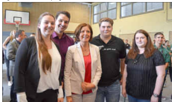
Zu einem Erinnerungsfoto war sie spontan bereit.