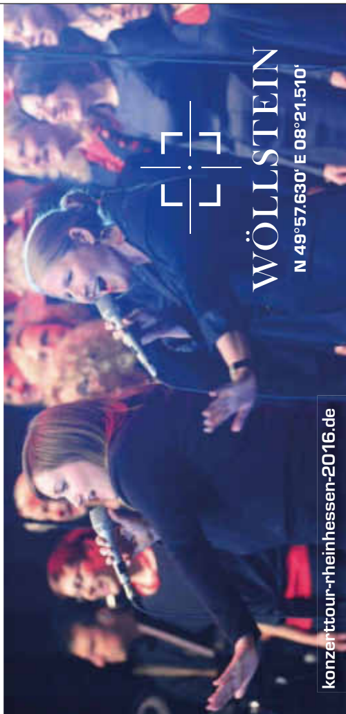
Hg: EWR AG, Lühweg 5, 67347 Worms

D A S J U B I L Ä U M S K O N Z E R T M I T P O P C H O R N