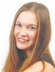
Carolina geht weltwärts