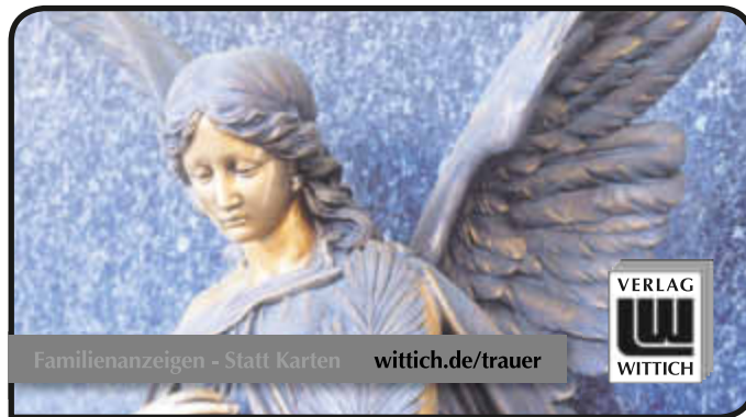
Familienanzeigen - Statt Karten wittich.de/trauer