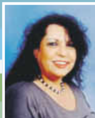
Ich berate Sie gerne!

IHRE ANSPRECHPARTNERIN für Anzeigenwerbung in Ihrem Mitteilungsblatt