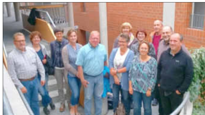
Das Bild zeigt den VR und GPGR in Naurod

selbst, aber auch allen Menschen unserer Tage durchaus noch etwas Wertvolles und Heilsames zu bieten hat. Der Klausurtag in Naurod hat alle TeilnehmerInnen motiviert, hier weiter nach neuen, erfolgversprechenden Wegen zu suchen; dies gemeinsam in unserer Pfarrgruppe mit Freude und Ausdauer zu tun. Wir danken allen, die sich in den Gremien und Gruppen der Pfarrgruppe einbringen. Der Gesamtpfarrgemeinderat sucht weiterhin Vertreter aus Wonsheim, Stein-Bockenheim und Eckelsheim für diese Gremienarbeit.