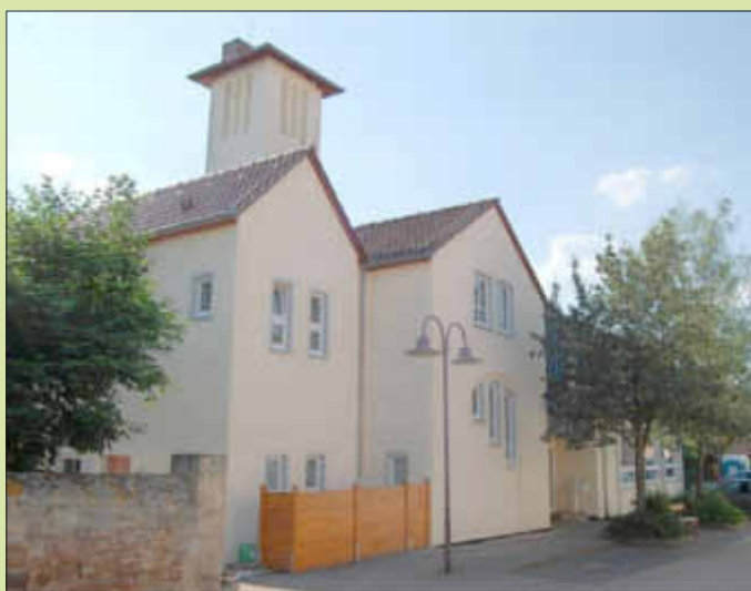
Unser Kindergarten mit neuem Außenanstrich 2017