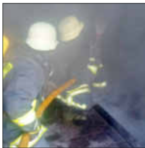
extremen Bedingungen sind.

müssen die Feuerwehrleute wortwörtlich kühlen Kopf bewahren. Am Nachmittag wurden dann die vorgestellten Vorgehensweisen und Löschtaktiken im Brandcontainer unter realen Bedingungen angewendet. Von den Teilnehmern wurde sehr viel abverlangt.