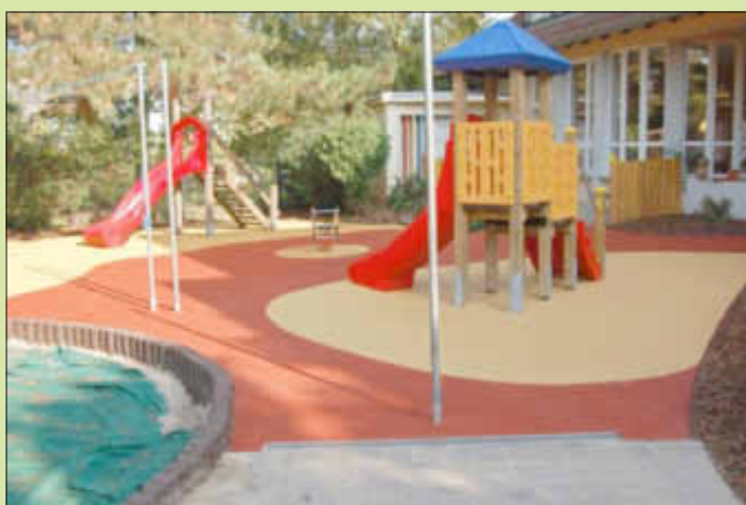
Im Jahr 2014 wurde im Außenbereich Fallschutzbelag verlegt.