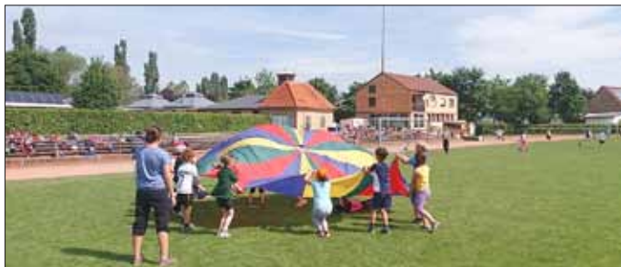
Entspannungsstation zwischen den Wettkämpfen der Bundesjugendspiele