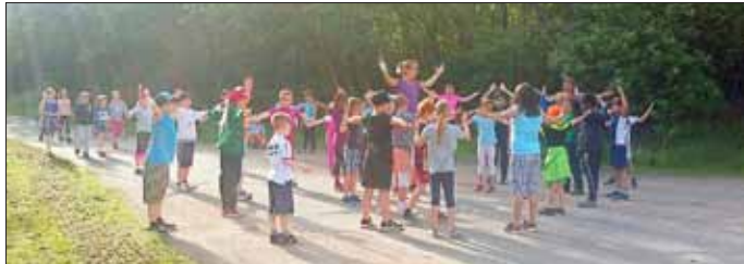
Joggen und Gymnastik im Tälchen