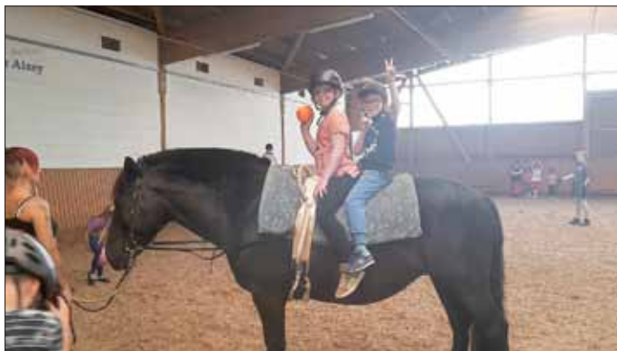
Voltigieren in der Reithalle Wonsheim

Sportlich geht es weiter: Gemeinsam mit dem Kollegium, hat Frau Seelig ein Schwimmkonzept aufgestellt. Das Freibad Wöllstein soll dazu immer genutzt werden, wenn die Wetterlage stabil ist. Auch hier wird Frau Sack federführend die Schwimmer und die vielen Nichtschwimmer der Klassen 3 und 4 unterrichten.