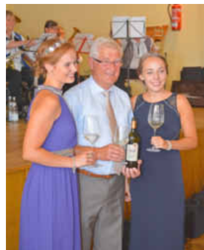
Vorstellung des Jubiläumsweines durch die Weinmajestäten