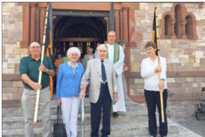
Auszug nach dem Gottesdienst mit den Bannern der Kolpingsfamilien Alzey und Rhein Hessische Schweiz.

3. St. Cäcilia: Das Grillfest mit dem Dank- und Taufgottesdienst am 9. Juli war ein gelungener Tag. Wir danken für die Salat- und Kuchen Spenden und allen Gästen für ihr Kommen, besonders den Mitgliedern des Kolpingbezirkes, die eigens nach Wöllstein gefahren sind. Trotz der Hitze waren wir vom Gesang des Chores beeindruckt und können alle aktiven Sänger und Sängerinnen mit ihrem Chorleiter nur loben. Unser Chor sucht noch immer mutige Männerstimmen. Da der Chor auch während der Ferien probt, können mutige Männer donnerstags um 19.30 Uhr gerne ins Remigiusheim kommen!