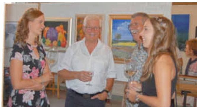
VG-Majestäten bei der Eröffnung der Gemäldeausstellung des Malkreises