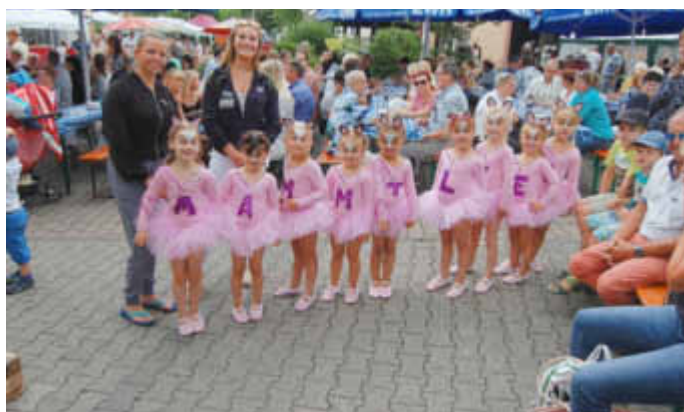
Tanzgruppe Honey aus Stein-Bockenheim vor ihrem Auftritt