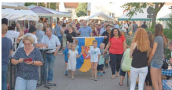
Die Eröffnung des Johannisfestes durch die Veranstalter