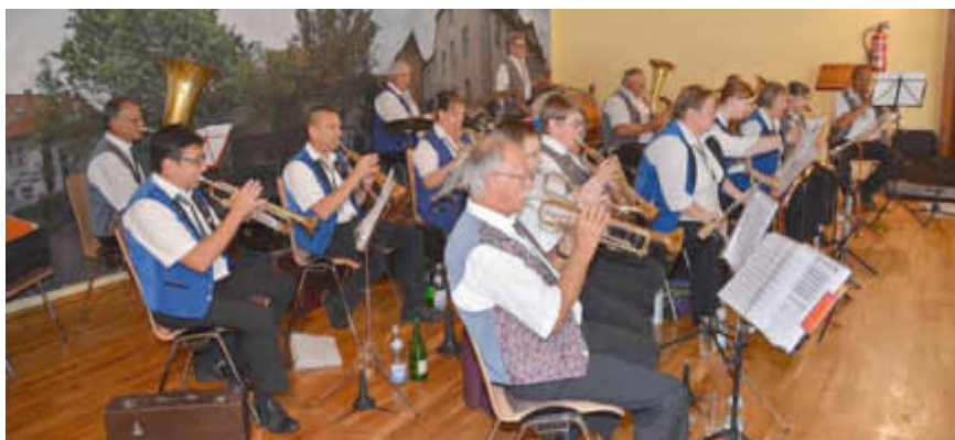
Spielereinigung Wendelsheim/Mauchenheim bei der Eröffnung des Festaktes