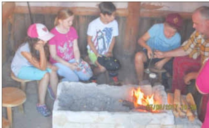
Beim Münzen gießen im Keltendorf-Steinbach