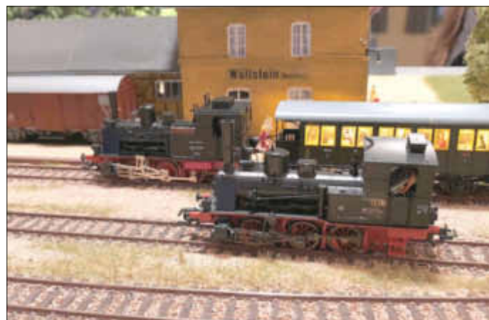
Fahrbetrieb am Bahnhof Wöllstein (Rhein Hess.)

Die Modellbahnfreunde des IG Bawettche e.V. zeigten über den Wöllsteiner Weihnachtsmarkt ihre Vereinsanlage im Evangelischen Gemeindehaus in der Pfarrgasse. Die zahlreichen Besucher konn-