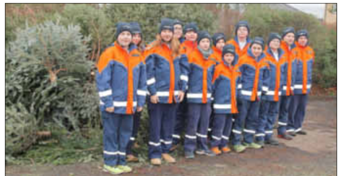
Ihre Jugendfeuerwehr Stein-Bockenheim

Ebenso möchten wir uns für die zahlreichen Spenden bei unserer diesjährigen Weihnachtsbaum-Einsammelaktion bedanken und wünschen Ihnen auch auf diesem Weg nochmals alles Gute für das kommende Jahr!