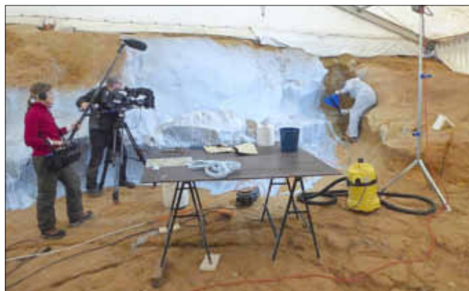
Aufbringen des Silikons für den Abdruck, während der Fernsehaufnahmen von SWR 3, 15.01.2018