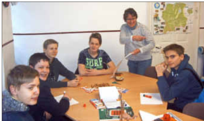
Ein Teil unserer Firmbewerber 2018 am 1. Firmkurstag