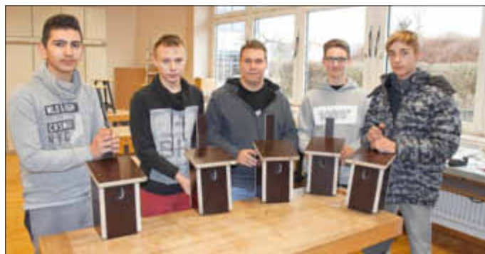
Stolz präsentierten sie ihre tollen Bauwerke