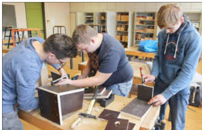
Die Schüler konzentriert bei der Arbeit