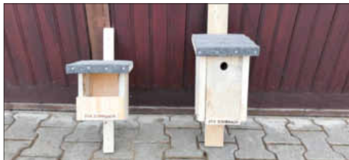
Schick sind auch die Nistkästen der JVA