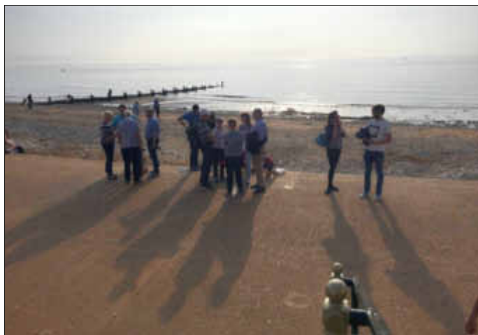
an der Nordsee