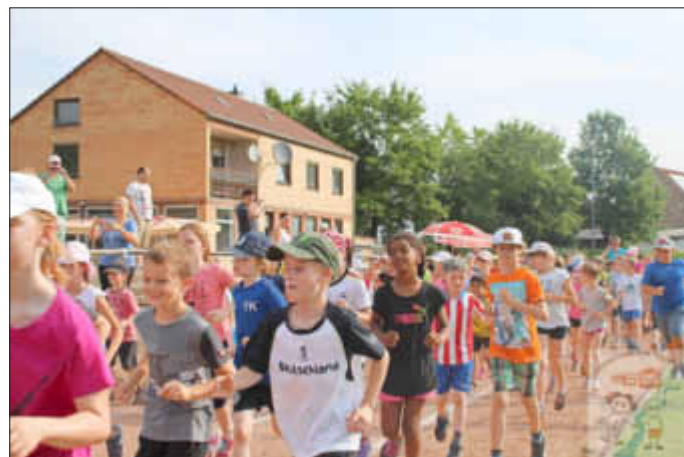
Startschuss für den Spendenlauf bei hochsommerlichen Temperaturen