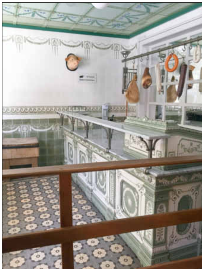
Die ehemalige Wöllsteiner Metzgerei in Freilichtmuseum in Bad Sobernheim

Nach dem ausführlichen Frühstück ging es mit dem Bus ins Freilichtmuseum nach Bad Sobernheim. Dank der dort zur Verfügung stehenden Bollerwagen konnten wir unsere zahlreich mitgebrachten Kühltaschen gut zu den Führungen mitnehmen und somit war die Hitze gut erträglich, zumal es im Museum auch schöne Schattenplätze gibt. Die Ortsgemeinde hatte zwei Führungen organisiert, eine in deutscher und eine in französischer Sprache: Beide waren hervorragend und sehr interessant. Besonders beeindruckend war für uns die ehemalige Wöllsteiner Metzgerei mit ihrer tollen Inneneinrichtung.