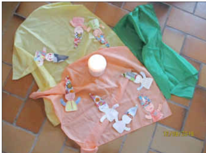
Mitte im Kindergottesdienst zum Thema „Stark und Schwach“