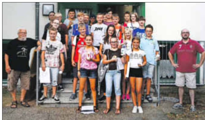
Unsere Konfirmandinnen und Konfirmanden 2018/2019...

Dienstag - 16:00 Uhr im Gemeindehaus, Pfarrgasse 9 in Wöllstein.