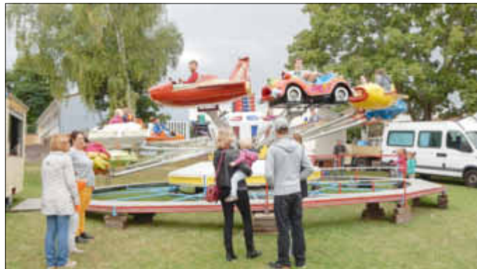
Immer beliebt bei den kleinen Gästen: Eine Fahrt mit dem Karussell.

Ab 16:30 Uhr starten dann die beliebten Freifahrten für die Kinder.