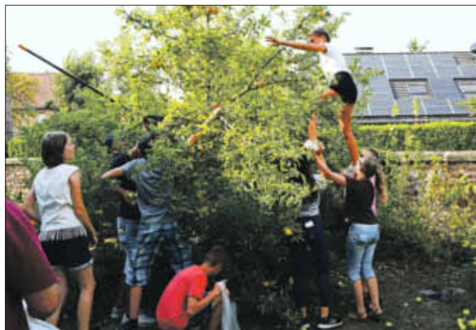
...bei der Apfelernte im Pfarrgarten