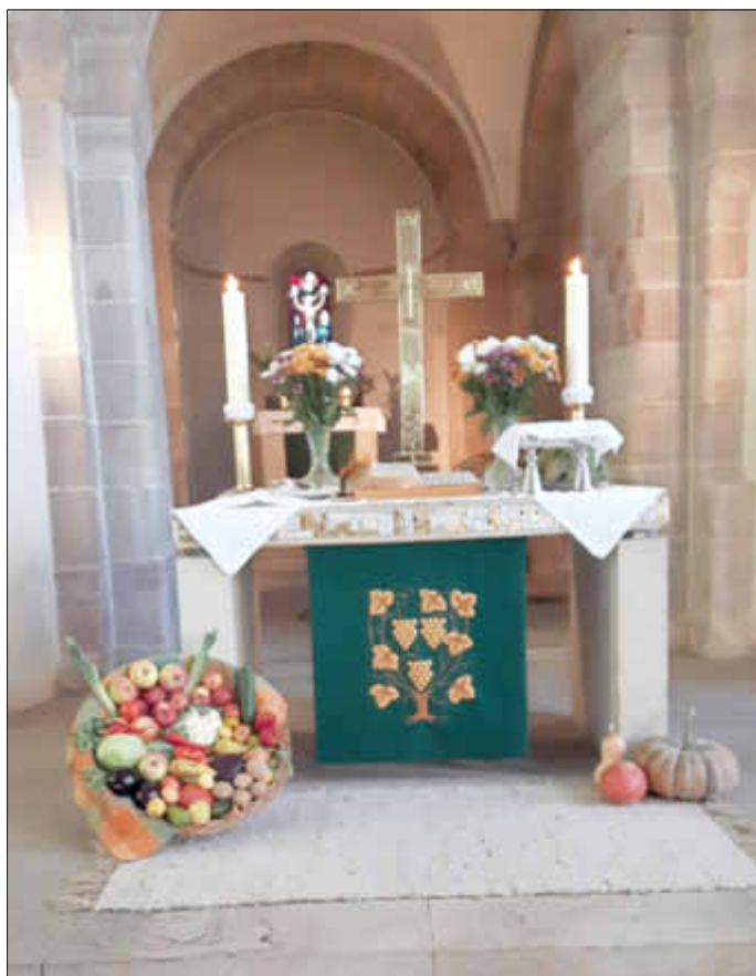
Erntedank in Wendelsheim

Rückblick: Am 21.10.2018 fanden Erntedankgottesdienste in unseren Gemeinden statt. Dank an alle Mitwirkenden bei den Gottesdiensten und den Spendern für Blumen, Obst und Gemüse.