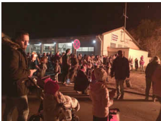
Das beeindruckende Feuer fand viele Bewunderer

Danke sagen wir vor allem der Freiwilligen Feuerwehr, den Mitgliedern des Fördervereins, allen Helfern und Helferinnen sowie den Mitarbeitern der Ortsgemeinde Wöllstein!