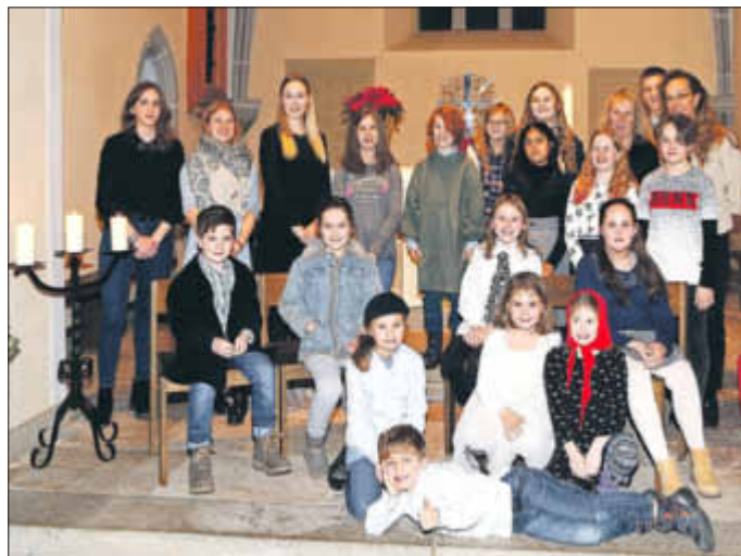
Die Kinder vom Krippenspiel mit Team. Wir freuen uns auf dieses Jahr! Für aktuelle Informationen, kommende und vergangene Veranstaltungen besuchen Sie bitte unsere Homepage www.ev-kirche-woellstein.de