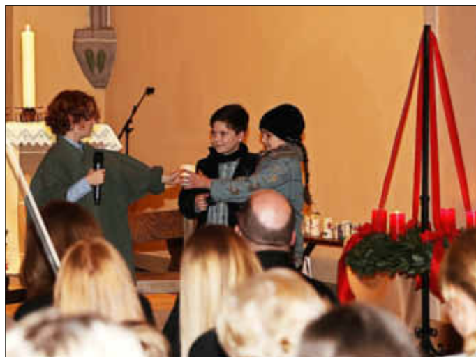
Der Engel Willibald bringt das Licht von Weihnachten zu den Obdachlosen.