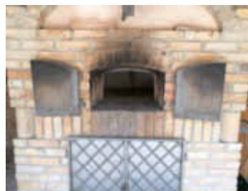
Der Dorbackofen in Eckelsheim

Es ist so weit. Die Mitglieder der IG Dorbackofen in Eckelsheim heizen wieder den Backes hinter der ev. Kirche an. Nach einer Winterpause starten wir in die Backsaison 2019.