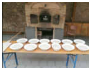
Brote während der Stückgare

Es ist wieder soweit. Die Mitglieder der IG Dorbackofen in Eckelsheim heizen den Backes hinter der ev. Kirche in Eckelsheim an.