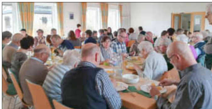
Fastenessen in Siefersheim

3. Fastenessen: Wir laden zum Fastenessen am 7. April in Wöllstein ein. Wir konnten im Rahmen des Fastenessen in Siefersheim 391 Euro Spenden einnehmen. Wir danken allen, die die leckeren Heringe „gefangen und zubereitet“ haben und allen, die in Gemeinschaft gegessen und gespendet haben. Die kompletten Einnahmen gehen an Misereor. Danke!