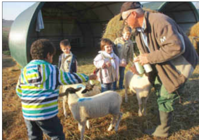
Biber füttern die Lämmer!

4. Pfadfinder: Die Kinderstufen der Pfadfinder haben die Schafe der Familie Rathgeber besucht. Wir danken den Herren Rathgeber für das Zeigen der Schafe und die nette Führung über das Gelände. Den Schafen danken wir für die Geduld und den friedlichen Umgang mit unseren Pfadfindern.