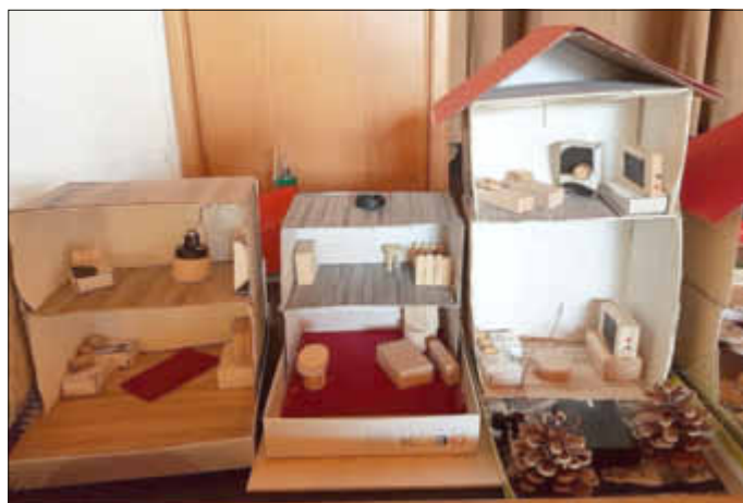
Ein modernes Wohnquartier wurde errichtet

Egal wie groß der Andrang war, die Betreuer/innen behielten den Überblick und vor allem die Ruhe. Die Belohnung aller Anstrengungen waren die strahlenden Gesichter der Kinder, wenn ein Glühbirnchen leuchtete oder blinkte, eine Propellerschraube sich drehte oder das Windmobil durch kräftiges Pusten davon sauste.