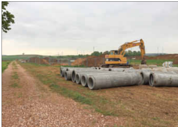
Im Anschluss an diese Arbeiten geht es mit den Kanalarbeiten im eigentlichen Baugebiet weiter.

Große Betonrohre liegen bereit, um das Niederschlagswasser aus dem neuen Wohnbaugebiet entlang des Feldweges in östliche Richtung zu leiten. Dort wird ein Regenrückhaltebecken neben dem Dünzelbach gebaut. Der Schmutzwasserkanal wird derzeit ebenfalls verlegt und in Verlängerung des Scheideweges an das vorhandene Kanalnetz angebunden - auch dies ist bereits zu erkennen.