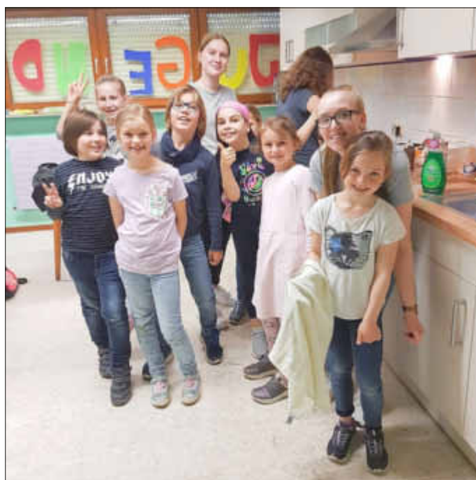
Gute Stimmung im Kinderküchenteam

Wie verschiedene Stoffe miteinander reagieren konnten die Kinder bei Versuchen beobachten, bei denen Backpulver und Essig in einem kleinen Fläschchen aufeinandertrafen und einen Luftballon aufpusteten. Backpulver, Essig und ein wenig Spülmittel brachten den zuvor selbst gebastelten Vulkan zum Ausbruch. Behäbig blubberte die „Lava“ aus dem Krater.