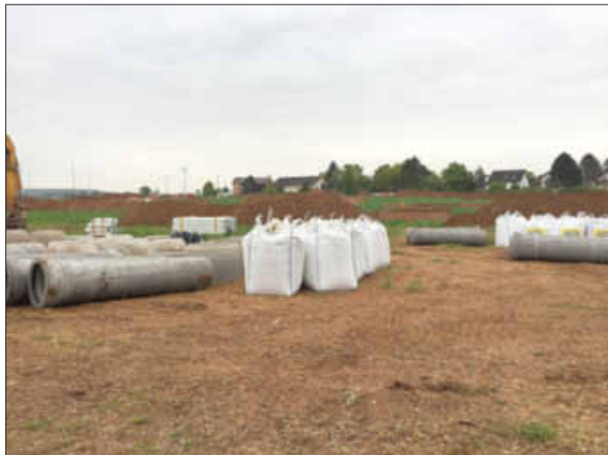
Der Auftrag für die Kanalarbeiten sowie für die anschließenden Straßenbauarbeiten wurden an die Firma Knebel Bau aus Bingen vergeben. Die Arbeiten werden voraussichtlich bis Ende 2019 dauern.