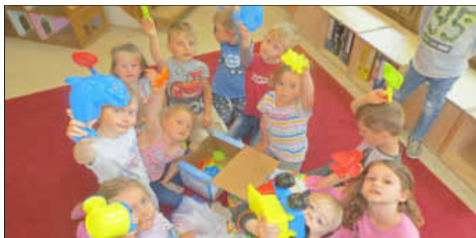
- und jetzt die Freude!