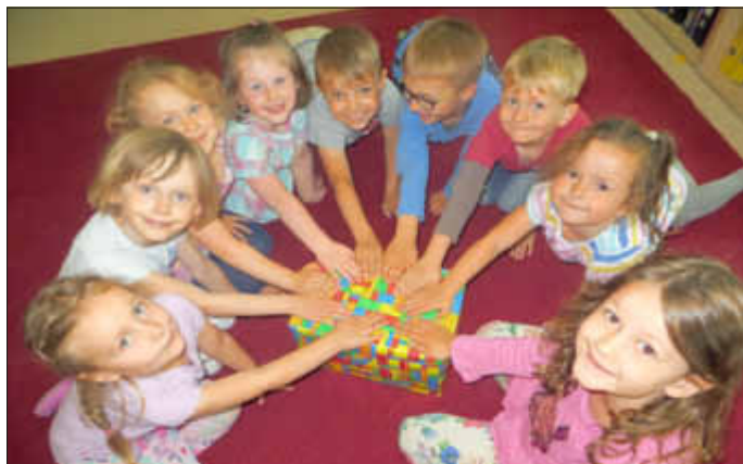
Die Spannung ist groß ...