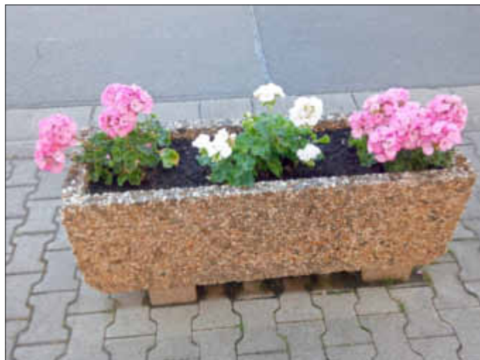
In voller Blütenpracht