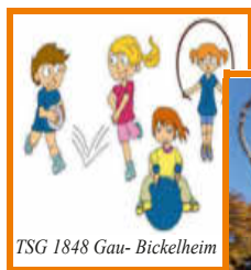
TSG 1848 Gau- Bickelheim