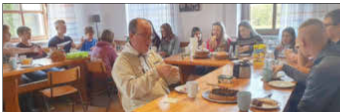
Unsere Pfadfinder und Ministranten in Boxbrunn