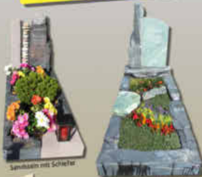
Sandstein mit Schiefer