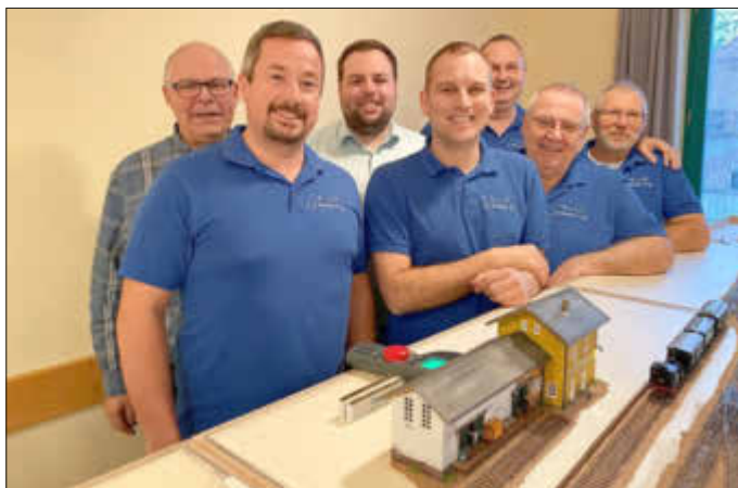
Vereinsmitglieder vor der Anlage mit Wöllsteiner Bahnhof

Damit die Vereinsanlage weiter ausgebaut und gestaltet werden kann, ist neben vielen Stunden der Arbeit, auch immer finanzielle Unterstützung notwendig. Deshalb möchte sich die IG Bawettche e. V. ganz herzlich bei den vielen Spendern und Käufern der leckeren selbstgemachten Pralinen bedanken, die es ermöglichen, dass die Anlage immer weiter wächst. Ein großes Dankeschön gilt auch der evangelischen Kirchengemeinde, die die Räumlichkeiten zur Verfügung stellt.