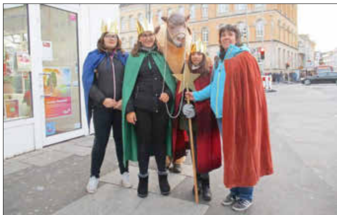
Karimm u. Co Artgenosse aus Hamm