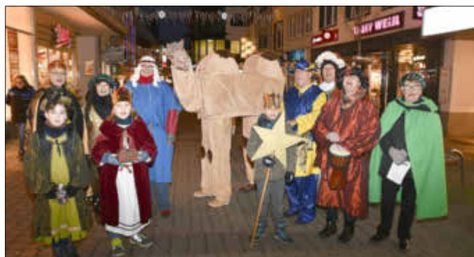
In der Fußgängerzone Königliche Straßensperre in Fürfeld