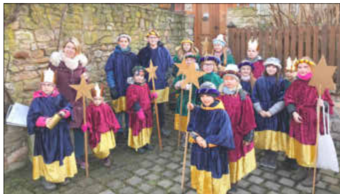
Sternsinger in Eckelsheim