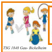
TSG 1848 Gau- Bickelheim