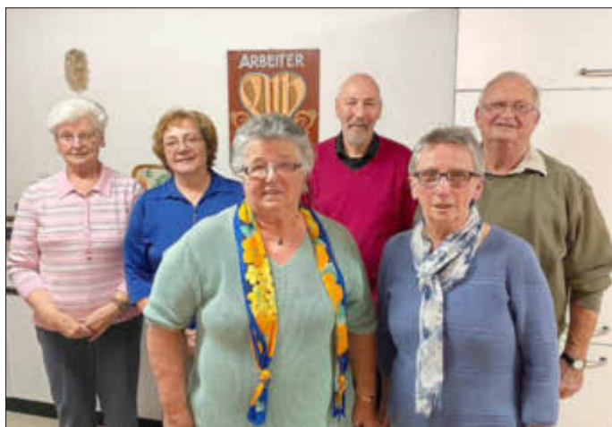
Der neue Vorstand der AWO Wöllstein

Wegen des Coronavirus und in Absprache mit der Ortsgemeinde finden vorübergehend keine Seniorennachmittage der AWO Wöllstein mehr statt. Sobald wir uns wieder treffen, wird dies im Amtsblatt veröffentlicht.