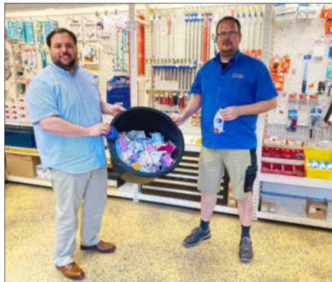
Sammlung von Alltagsmasken